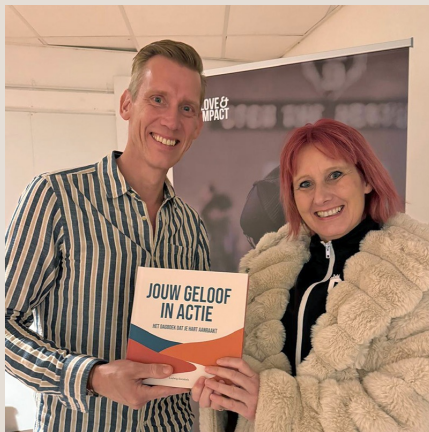
Verkoop van het eerste exemplaar

Dit dagboek is bedoeld om jou te helpen in je tijd met God. Om jou aan te sporen meer tijd met Hem door te brengen zodat Hij tot jou gaat spreken. We hebben 80 overdenkingen geschreven met vragen en Bijbelgedeelten. Dit alles is in een mooi en luxe boek gegoten voor een speciaal moment met Hem. Een ideaal cadeau voor de kerst zou ik zeggen! Wees er dus snel bij! Je kunt hem bestellen in de bookshop op de website. Wil je het boek fysiek bekijken? Dat kan vanaf deze week in De Fakkel in Eindhoven.